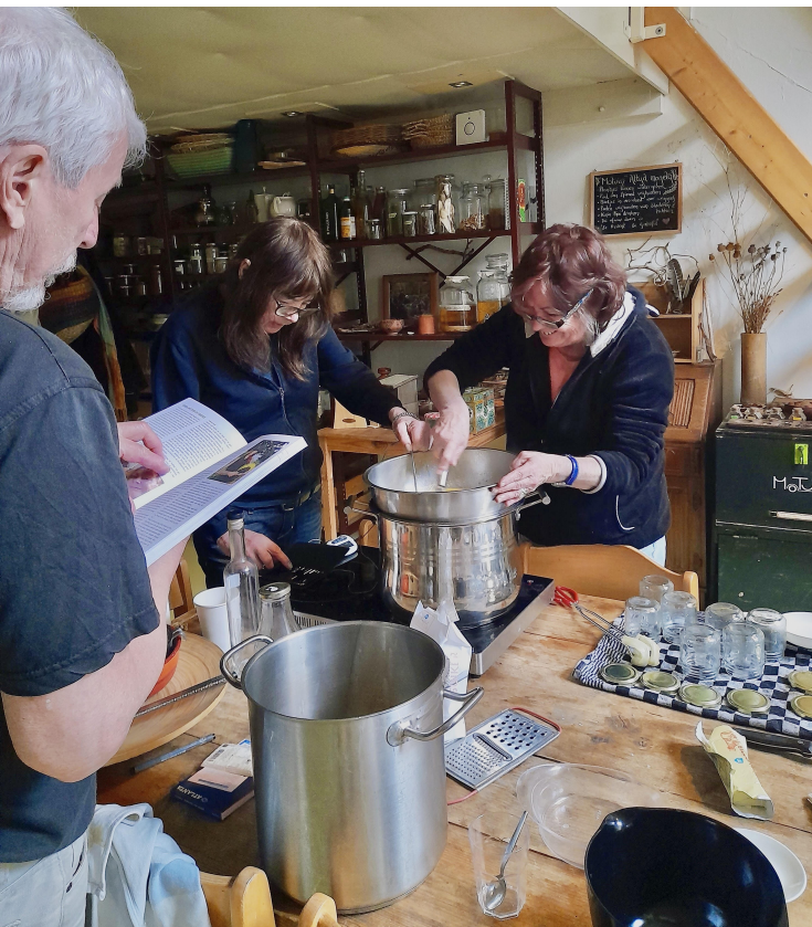
Workshop Jam maken

2025 was een jaar met af en toe moeizame momenten, maar tevens met duidelijke successen. We zien groei in productie, omzet en bezoekersaantallen; onze sponsordiners waren zeer succesvol en vonden plaats op prachtige locaties; en de groei van het aantal bedrijfsuitjes droeg flink bij aan onze inkomsten. Met de vernieuwing van de website en het ingebouwde boekings- en betalingssysteem zijn onze activitei-