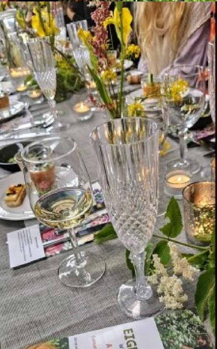
Bedrijfsuitje in de Boerenstal

damse Bodem tijdens een wildplukwandeling en publiceerden over onze rivierkreeften-viswedstrijd in het Amstelveens Nieuwsblad. Op Instagram plaatsen we maandelijks de agenda en regelmatig foto's en reels om sfeer en activiteiten te tonen. Het aantal volgers nam dit jaar met bijna 200 toe.