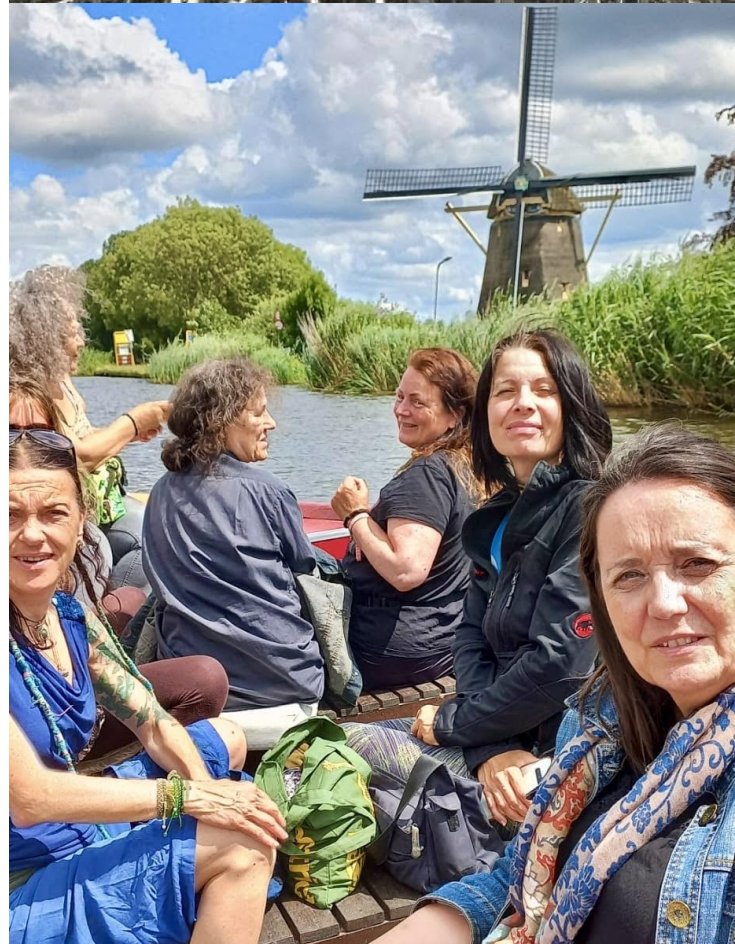
Met de Noorderzon naar het Voedselbos