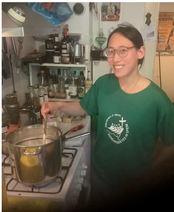
Lok Thong roert vlierbloesem