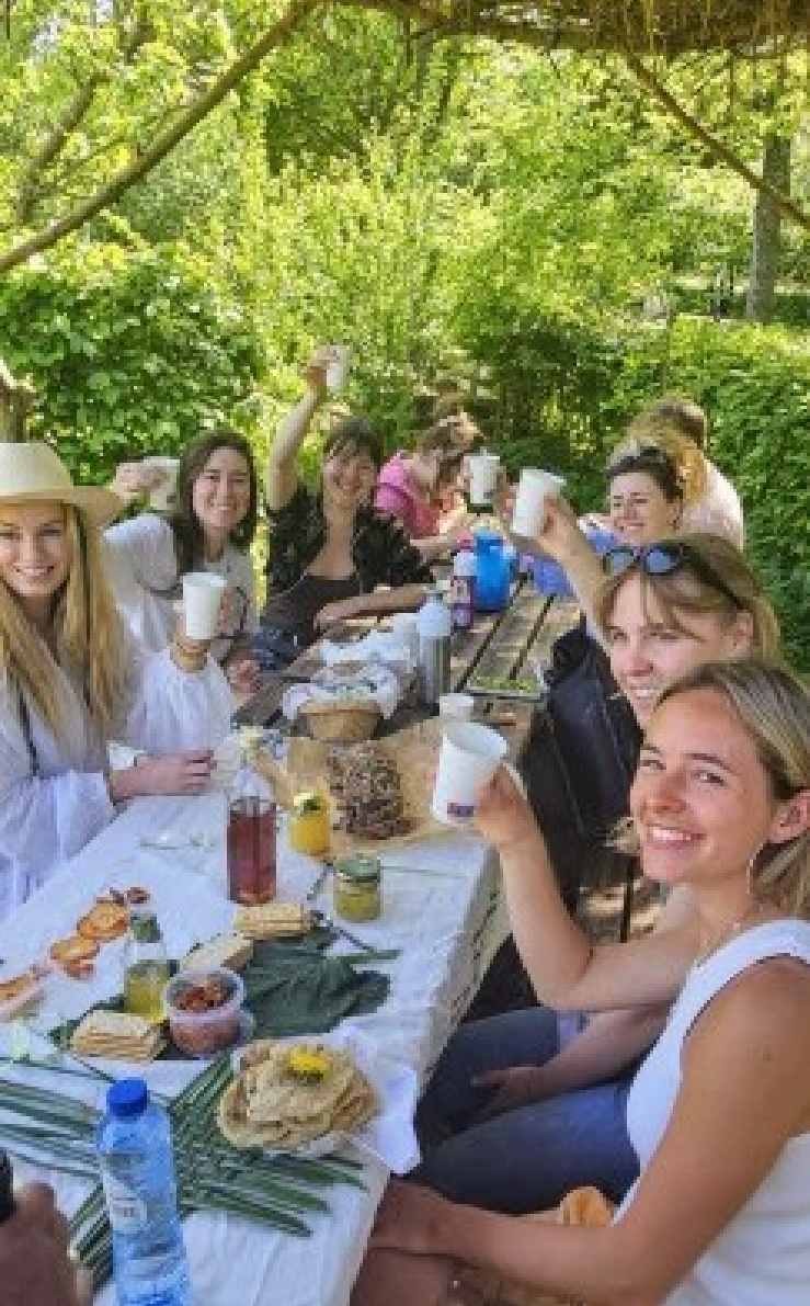
Wildplukwandeling met Moos

Ook waren er drie sessies om gans en haas te fileren. Samen met de Buurtwerkplaats zetten we de cursus ‘ambachtelijk conserveren’ op met vier docenten. Dat programma was vrijwel direct uitverkocht en start in februari.