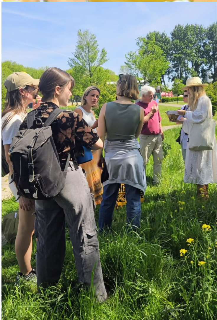
Excursie in het Sloterpark