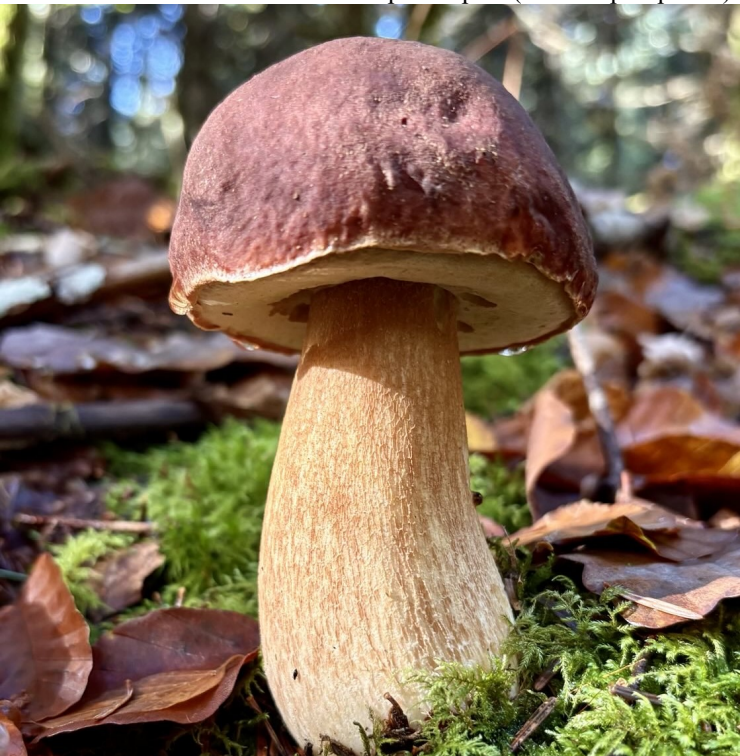
Een Franse cèpe des pins (Boletus pinophilus)