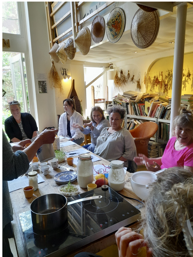
Workshop in Tugela85